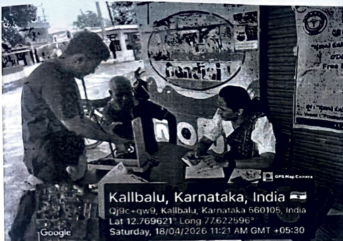
Kallbalu, Karnataka, India Qj9c+qw9, Kallbalu, Karnataka 560105, India Lat 12.769621° Long 77.622596° Saturday, 18/04/2026 11:21 AM GMT +05:30