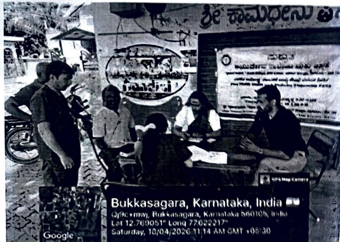
Bukkasagara, Karnataka, India Qj9c+mwj, Bukkasagara, Karnataka 560105, India Lat 12.769051° Long 77.622217° Saturday, 18/04/2026 11:14 AM GMT +05:30